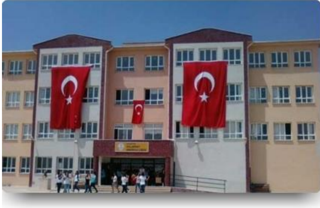
Seyrek Villakent Anadolu Lisesi